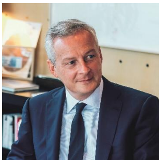
Bruno Le Maire, ministre de l'Économie, des Finances et de la Relance

La relance est l'occasion pour la France de se positionner à la pointe des technologies de rupture qui seront au cœur du monde de demain. L'hydrogène décarboné est l'une d'entre elles.