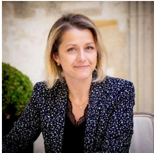
Barbara Pompili, ministre de la Transition écologique