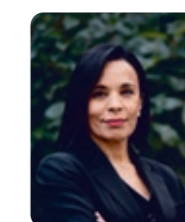
Salima Saa, secrétaire d'État chargée de l'Égalité entre les Femmes et les Hommes