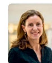
Charlotte Parmentier-Lecocq, ministre déléguée aux Personnes handicapées auprès du ministre des Solidarités