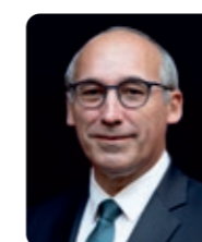
Paul Christophe, ministre des Solidarités, de l'Autonomie et de l'Égalité entre les Femmes et les Hommes