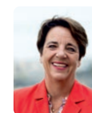
Agnès Canayer, ministre chargée de la Famille et de la Petite Enfance