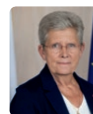
Geneviève Darrieussecq, ministre de la Santé et de l'Accès aux soins