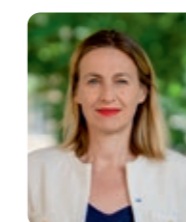
Astrid Panosyan-Bouvet, ministre du Travail et de l'Emploi