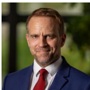
Marc FERRACCI Ministre chargé de l'Industrie et de l'Énergie

Souveraineté sanitaire, réindustrialisation et accès aux médicaments : ces ambitions du Gouvernement se concrétisent avec ces nouveaux projets.