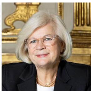
Catherine VAUTRIN Ministre du Travail, de la Santé, des Solidarités et des Familles

La crise du Covid-19 nous a collectivement fait prendre conscience d'une dure réalité : nous sommes, pour les médicaments les plus essentiels au fonctionnement de notre système de santé, assez largement dépendants de productions étrangères, et notamment extra-européennes.