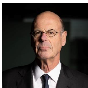
Eric LOMBARD Ministre de l'Economie, des Finances et de la Souveraineté industrielle et numérique

Pour renforcer notre capacité de production de produits de santé, nous avons lancé dans le cadre du plan de Relance plusieurs appels à projets qui nous ont permis d'enclencher une vraie dynamique. Le président de la République avait par ailleurs fixé en juin 2023 un objectif, que nous partageons : reconquérir notre souveraineté sanitaire, en ce qui concerne les médicaments essentiels au fonctionnement de notre système de santé.