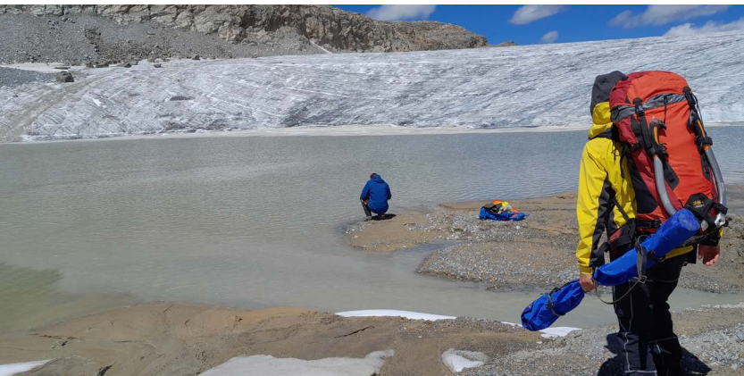
Mission de reconnaissance dans le cadre de la levée de doutes, réalisée par le service de restauration des terrains en montagne de l'ONF - Lac du Rosolin (commune de Tignes, Savoie), juillet 2023 - © ONF-RTM.

Une nouvelle convention permettant d'encadrer les travaux d'acquisition de connaissances nécessaires est proposée en continuité, dès 2024. Elle concerne des travaux dans les domaines de recherche identifiés comme cruciaux par la mission :