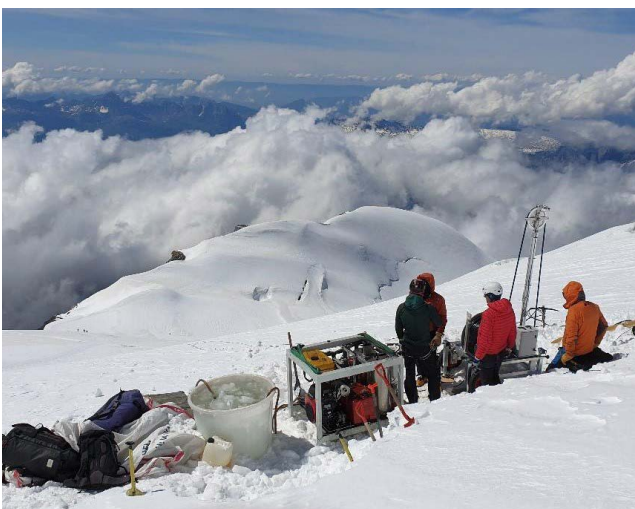
Forages profonds sur le glacier de Taconnaz (Chamonix, Haute-Savoie), juin 2021

nombre de projets sur les risques d'origines glaciaire et périglaciaire ayant reçu un soutien financier à l'appel à projets générique de l'ANR (sans cible)