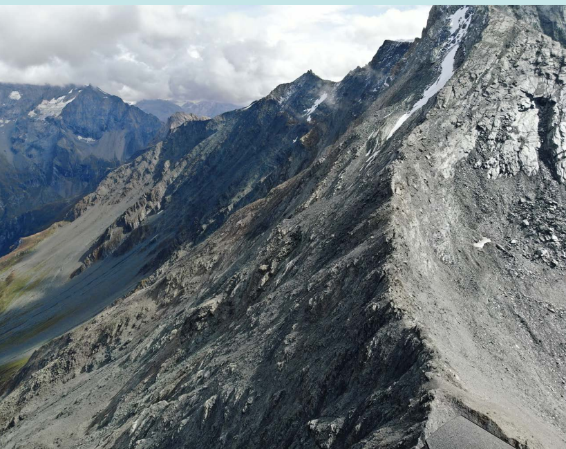
Paroi à pergélisol, face nord de Bellecôte (commune de Peisey-Nancroix, Savoie) - 2023

Les interventions sur ce site ont représenté un coût de 1,7 M€ en 2010-2011, et 500 000 € en 2012. Depuis, les études de connaissances et de suivi de l'évolution de ce site (de l'ordre de 200 à 300 000 € par an) sont soutenues par le MTEECPR (FPRNM).