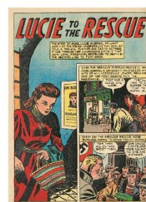
Bande dessinée racontant la résistance de Lucie Aubrac, publiée par True Comics et parue aux USA en 1946.

Elle raconte les actions extraordinaires de Lucie Aubrac.